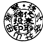
古印体 18 ミリ