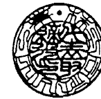
印相体 18 ミリ