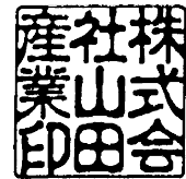
古印体 21 ミリ